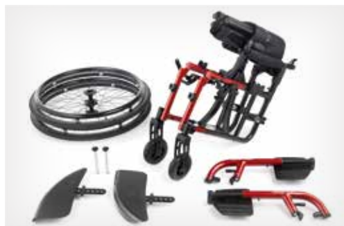
Démontable pour un transport facile