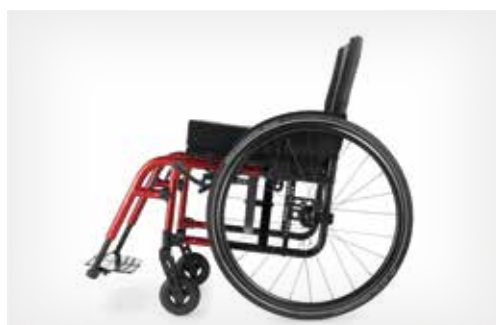
Potences à 70°, 80° ou 90°