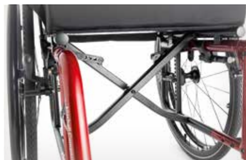
Pliant en un tour de main