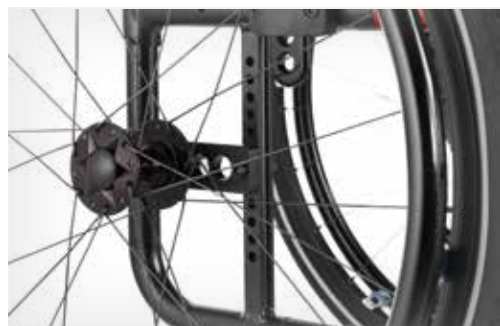
Réglage facile de la fixation des roues arrière