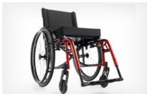
Pliant. Fonctionnel. Compact