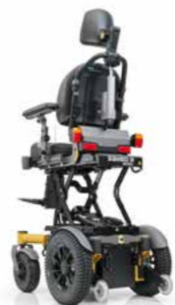
SANGO slimline lift RWD junior