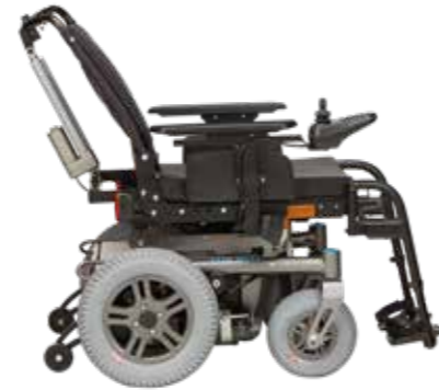
Dossier électrique inclinable en option