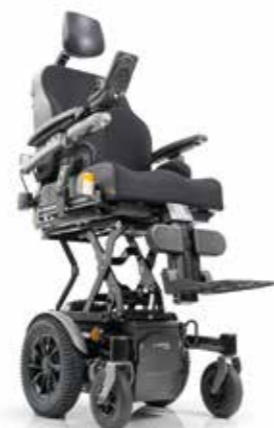
SANGO slimline lift MWD