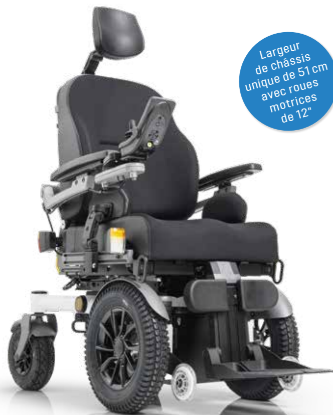
SANGO slimline FWD

Largeur de châssis unique de 51 cm avec roues motrices de 12"