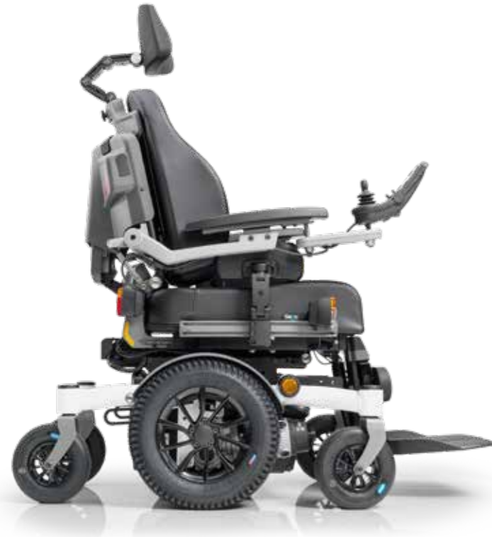
SANGO advanced MWD