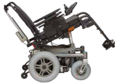
Disponible en option inclinaison d'assise électrique