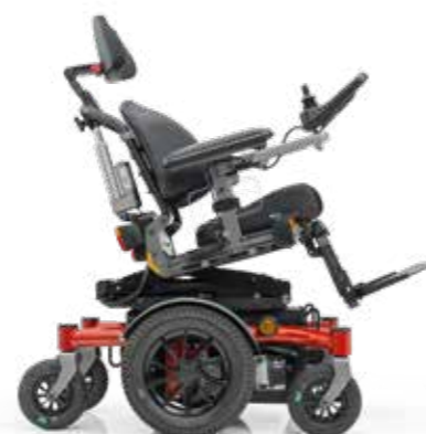
SANGO advanced MWD junior (illustration avec inclinaison électrique de l'assise)