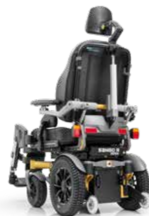
SANGO slimline RWD

Largeur de châssis unique de 51 cm avec roues motrices de 12"