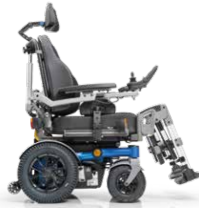
SANGO advanced RWD