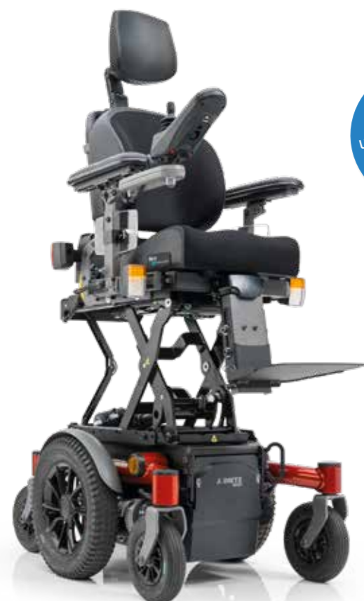
SANGO slimline lift MWD junior

Largeur de châssis unique de 51 cm avec roues motrices de 12"