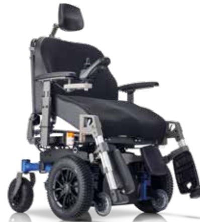
SANGO xxl FWD photo avec proclive