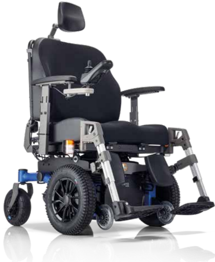
SANGO xxl FWD