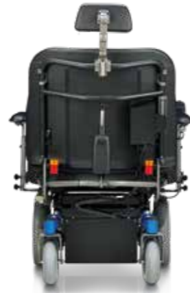
SANGO xxl FWD (vue arrière)