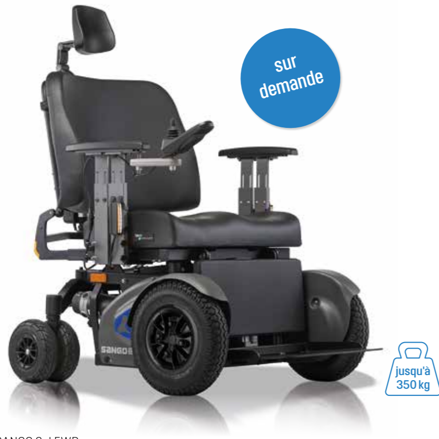
SANGO 3xl FWD