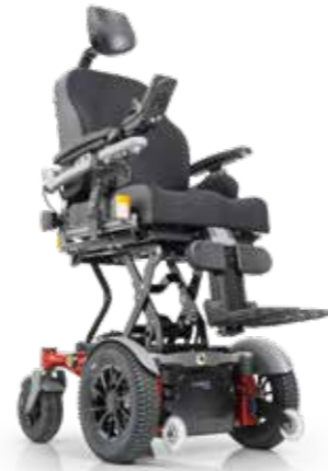
SANGO advanced lift FWD